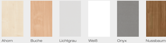
Ahorn Buche Lichtgrau Weiß Onyx Nussbaum