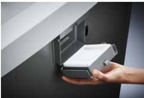
Dahle Aktenvernichter Security 516air