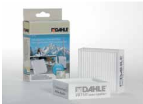
Feinstaubfilter Dahle 20710