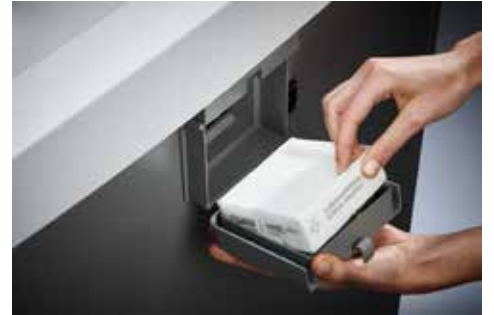
Dahle Aktenvernichter Security 516air