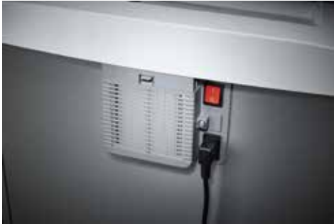
Dahle Aktenvernichter Security 516air