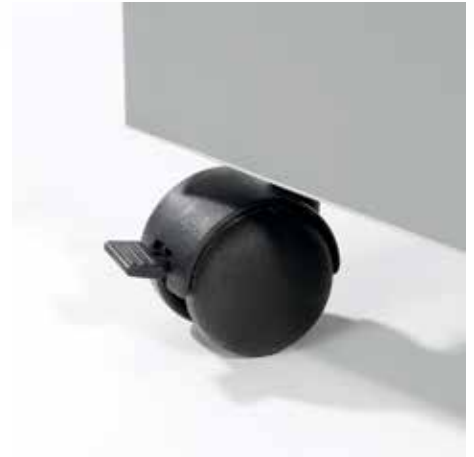
Praktische Lenkrollen für den flexiblen Einsatz