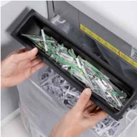
Separate, integrierte Auffangbehälter unterstützen bei der umweltfreundlichen Abfalltrennung von Papier und CDs, DVDs, Scheck- und Kreditkarten