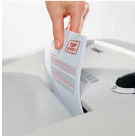
Bis zu 30 % höhere Blattleistung durch die innovative MHP Technology®