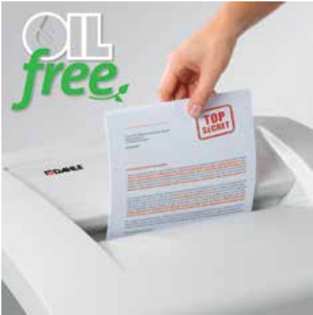
Komfortabel vernichten, völlig ohne zeitraubendes Ölen der Schneidwalzen