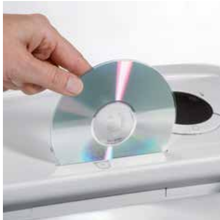
Separater Eingabeschlitz für CDs, DVDs, Scheck- und Kreditkarten garantiert eine sichere Vernichtung von optischen, magnetischen und/oder elektronischen Datenträgern