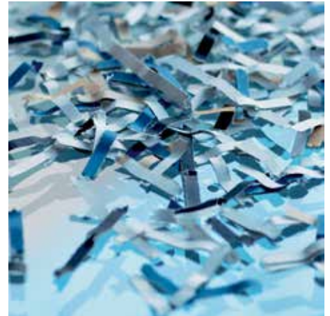
Sicherheitsstufe P-4: Empfohlen für Datenträger mit besonders sensiblen, vertraulichen und personenbezogenen Daten