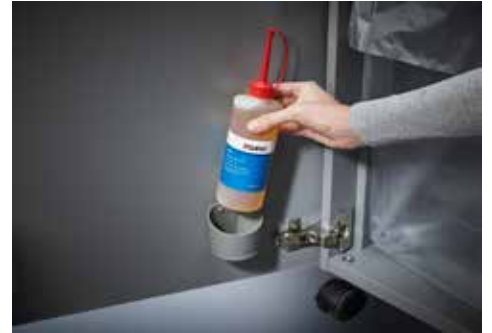
Dahle Aktenvernichter Top Secret 616