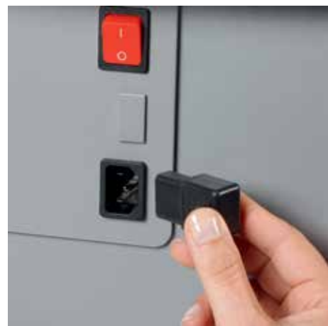
Abziehbarer Kaltgerätestecker vereinfacht das schnelle Bewegen des Aktenvernichters von A nach B