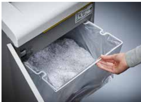
Dahle Aktenvernichter Top Secret 616