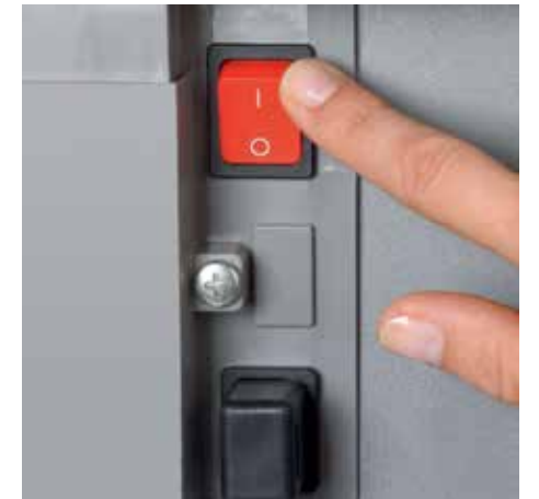
Separater Hauptschalter befindet sich auf der Rückseite des Aktenvernichters und trennt diesen komplett vom Netz