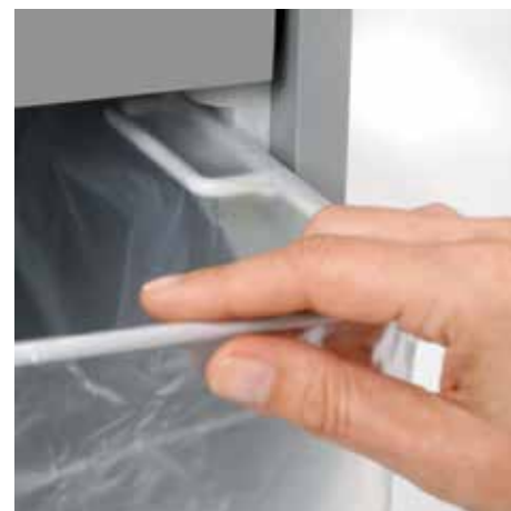
Ausziehbare, abgerundete Schiene ermöglicht das komfortable Wechseln des Auffangbeutels