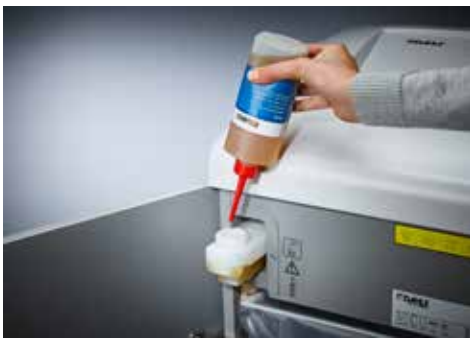
Dahle Aktenvernichter Top Secret 616