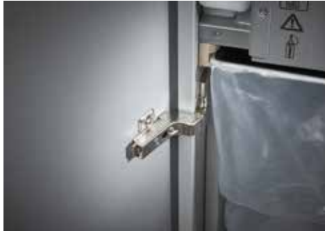
Dahle Aktenvernichter Top Secret 616