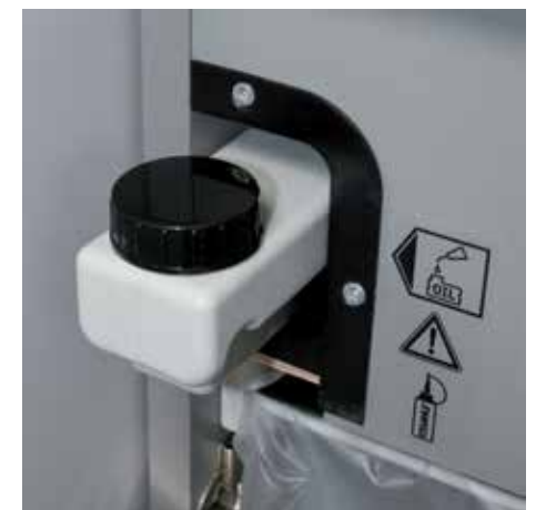
Integrierter Öltank für eine geregelte, automatische Ölung der Cross-Cut-Schneidwalzen fördert eine längere Laufzeit bei konstanter Leistung