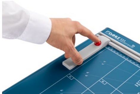
Dahle Schneidemaschine 533 - verstellbarer Rückanschlag zur schnellen Formatfindung