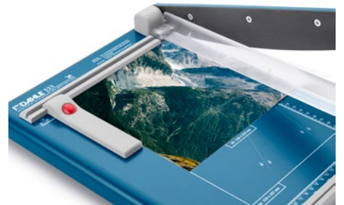
Dahle Schneidemaschine 533 - kompakter Hebelschneider für Hobby und Einstieg