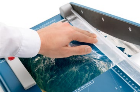
Dahle Schneidemaschine 533 - manuelle Pressung mit integriertem Fingerschutz zur sicheren Fixierung des Schnittgutes